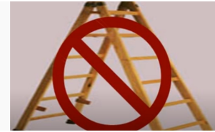
Pasar por debajo de una escalera