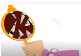
Romper un espejo