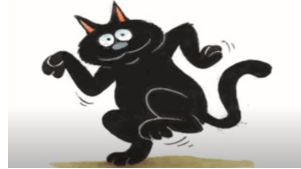
Ver un gato negro cruzar tu camino