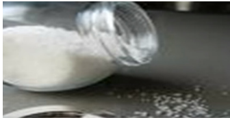
Tirar la sal en la mesa o en el suelo